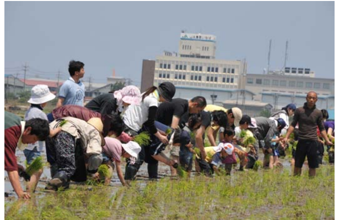
6月5日 第一回目の教室の様子です。